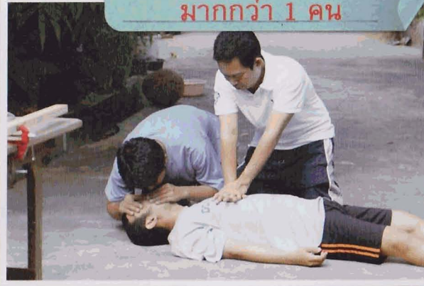
เป่าปาก 2 ครั้ง สลับกับการนวดหัวใจ 30 ครั้ง เท่ากับ 1 ชุด