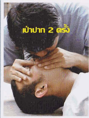
เป่าปาก 2 ครั้ง