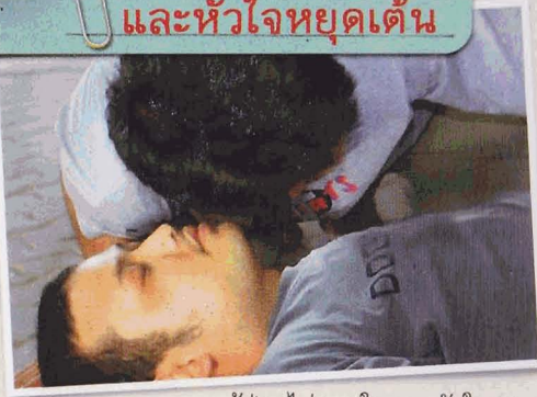
หากผู้ป่วยไม่หายใจและหัวใจหยุดเต้น