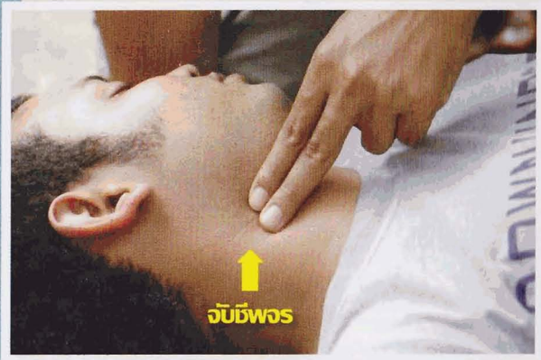
งับชีพจร