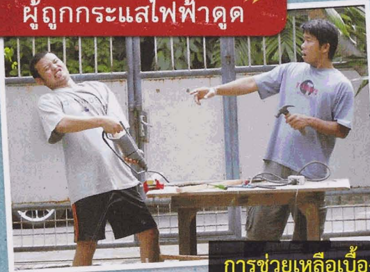
การช่วยเหลือเบื้องต้น