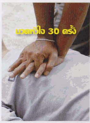
เวดกหัวใจ 30 ครั้ง