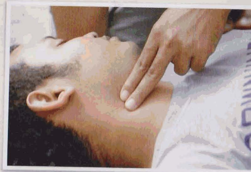
เป่าปากสลับกับการนวดหัวใจ 4 ชุด ให้ประเมินอาการของผู้ป่วย 1 ครั้ง โดยการจับชีพจร